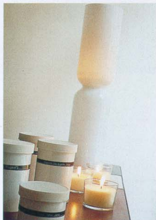
SUR UNE CONSOLE ARTIBUS, UN PHOTOPHORE IITTALA ET DES SENTEURS POUR LE BIEN-ÊTRE.

vouées à l'art de vivre chez soi, il met aussi en scène ses propres créations qui concourent à la dimension sensorielle du lieu, « comme une