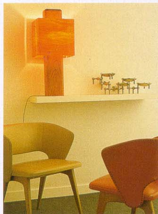
BÉTON TEINTÉ, CÉRAMIQUE, VERRE, LAQUE, MERISIER, CUIR... L'UNIVERS TOUT EN TOUCHER DU STUDIO 19.